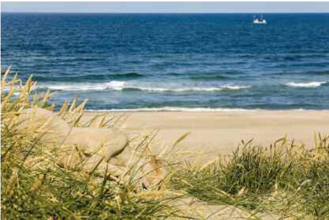
Dünen – Mensch – See