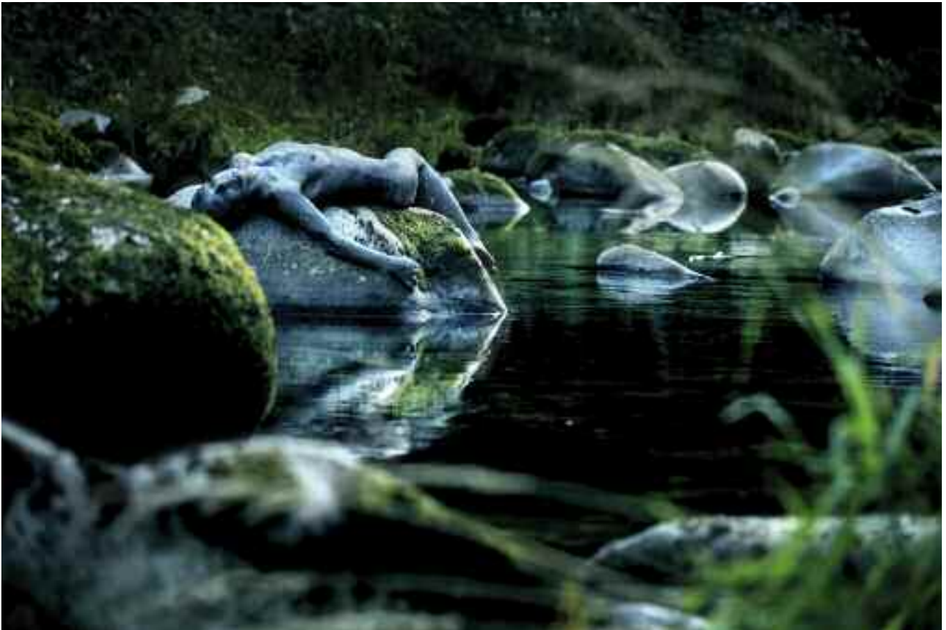
Sleeping stones enigma