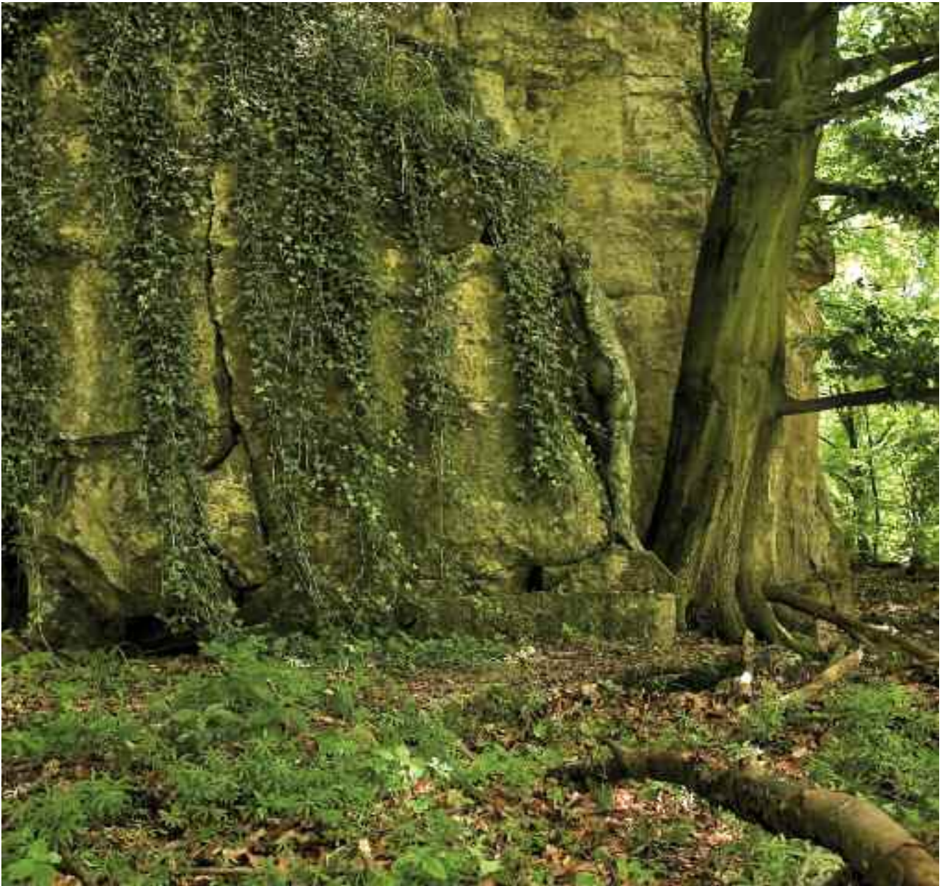
Die Schönheit hinter Ranken versteckt