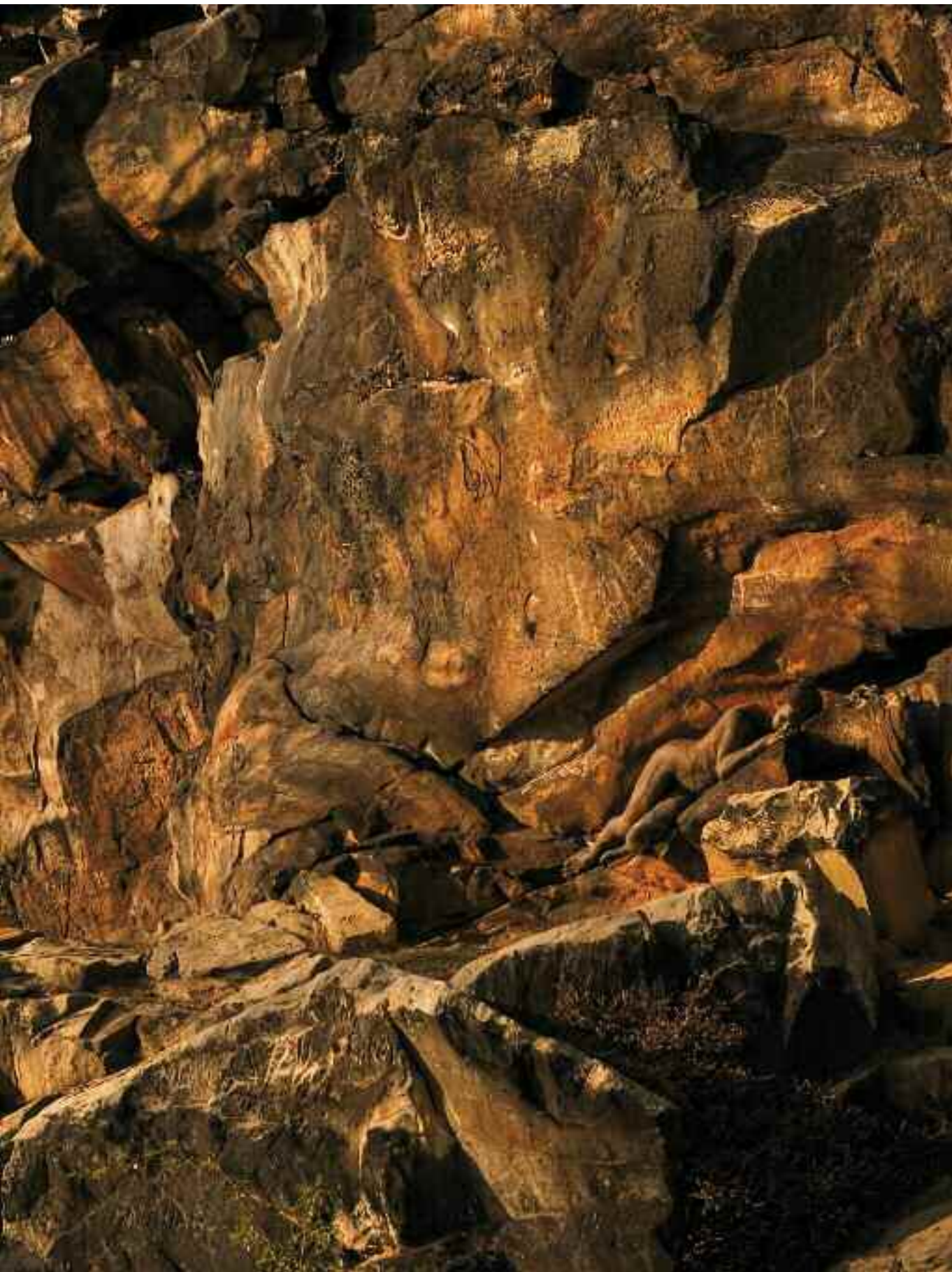
Des Teufels Wand