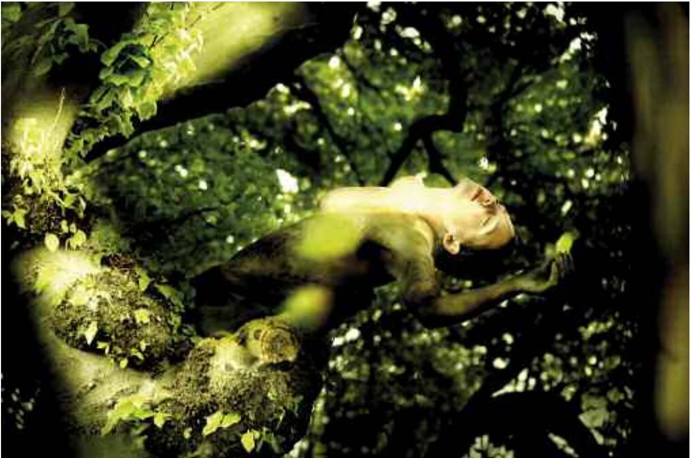
Dance of the tree